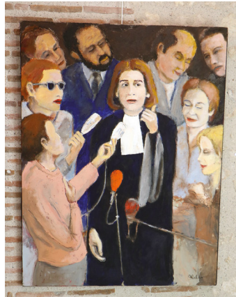
Jour J Téléthon